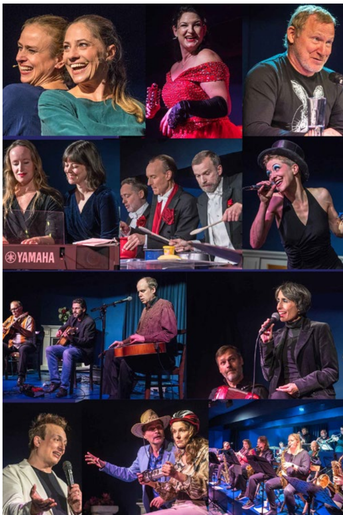
Künstler*innen aus dem Jahr 2025